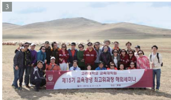
1. 글로벌리더 최고위과정 2. 국립중앙박물관에서의 현장수업 3. 교육경영 최고위과정 졸업여행 4. 글로벌리더 최고위과정 졸업여행