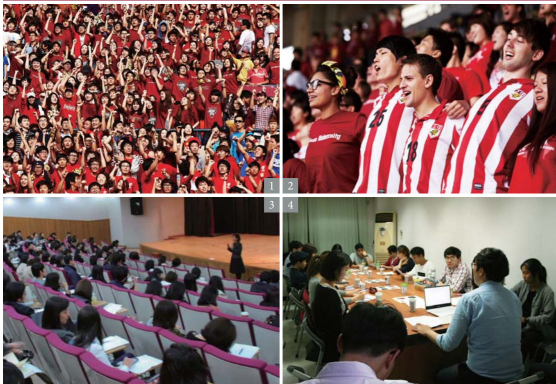
1. 정기 고·연전 2. 전공별 자치 학술활동 지원 3. 총학생회에서의 전공대표회의

약 13,000여 명의 졸업생들로 구성된 고려대학교 교육대학원 교우회는 회원 상호간의 친목과 모교발전 및 장학에 위하여 많은 활동과 사업을 하고 있습니다.